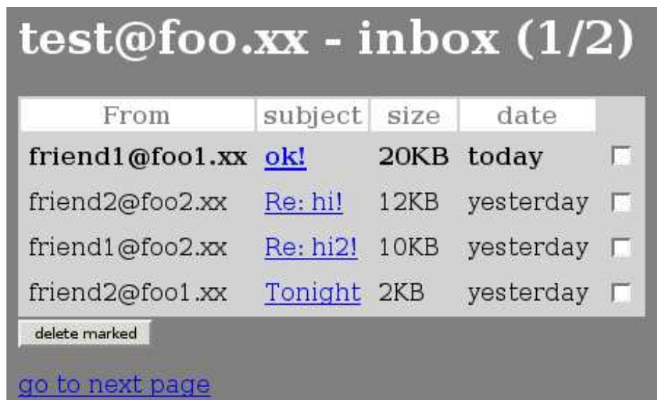
Figura 7: inbox

<input type="hidden" name="session_id" value="ABCD1234"> <table> <tr><th>From</th><th>subject</th><th>size</th><th>date</th></tr> <tr> <td><b>friend1@foo1.xx</b></td> <td><b><a href="/read.php?session_id=ABCD1234&uidl=123">ok!</a></b></td> <td><b>20KB</b></td> <td><b>today</b></td> <td><input type="checkbox" name="check_123"></td> </tr> <tr> <td>friend2@foo2.xx</td> <td><a href="/read.php?session_id=ABCD1234&uidl=124">Re: hi!</a></td> <td>12KB</td> <td>yesterday</td> <td><input type="checkbox" name="check_124"></td> </tr> </table> <input type="submit" value="delete marked"> </form> <a href="/inbox.php?session_id=ABCD1234&page=2">go to next page</a> </body>