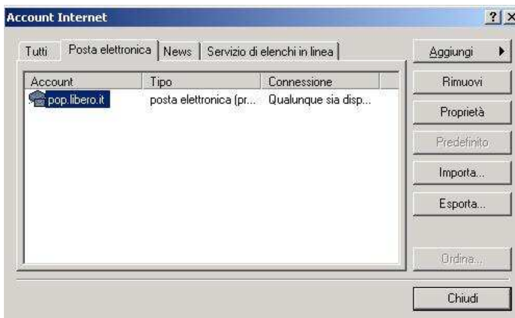
Figura 2: settings