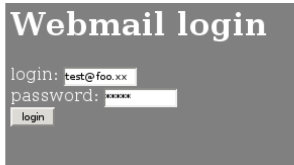
Figura 5: login

<form name="webmail" method="post" action="http://localhost:3000/"> login: <input type="text" size="10" name="username"> <br> password: <input type="password" size="10" name="password"> <br> <input type="submit" value="login"> </form> </body> </html>