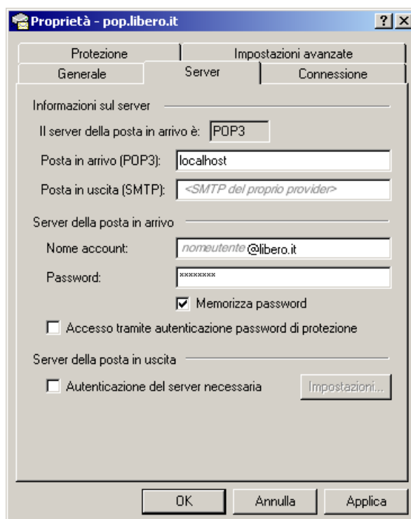
Figura 3: server